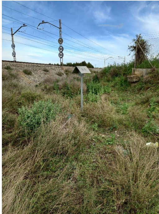
Imagen 2. Fotografía trazado actual Cruce vía de ferrocarril.

En el apartado 4 de esta separata se incluyen planos de las afecciones.